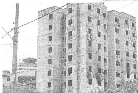
Construção arrematada tem 12 mil metros quadrados

O mercado municipal também ocupará um terço do espaço. Além de contar com mezanino, o mercadão possuirá uma área de convivência. Segundo o secretário municipal de Desenvolvimento