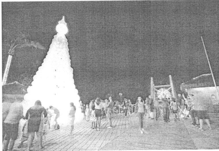
Expectativa dos organizadores é atrair 500 mil pessoas até o final do evento

A proposta do Pratas da Casa é valorizar o artista local