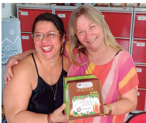
12/2015 - Sócia retira panetone na sede

Nos últimos meses, o Sinseri realizou diversas ações. Com isso, garantimos a capacitação dos Servidores e retribuimos toda confiança depositada. CONFIRA ALGUMAS.