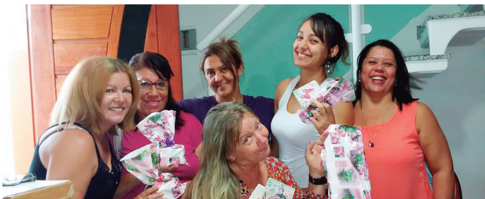
MULHERADA COM TUDO - Servidoras associadas não perderam tempo e estiveram na sede do Sinseri para retirar suas lembranças em homenagem ao Dia da Mulher

Servidor(a): fique ao lado de quem luta por você. Estamos juntos!