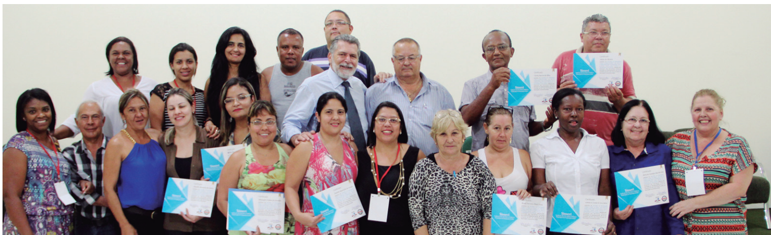
FORMAÇÃO - Servidores ficaram satisfeitos com as palestras sobre participação política e direito de greve, em novembro/2015

Seminários, entrega de lembranças, sorteios, tradicional festa do trabalhador, feira de roupas, entre outros, motivam os Servidores