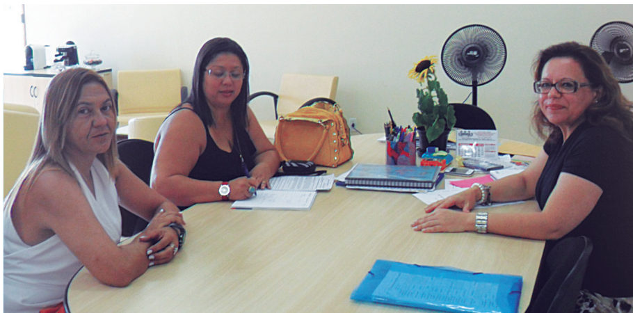
SINSERI EM NEGOCIAÇÃO - Sindicato negocia situação dos Professores na Secretaria de Educação. Não admitimos falta de respeito com os companheiros

PATRIMÔNIO - Atualmente, todo o nosso patrimônio é identificado - isso nunca ocorreu.