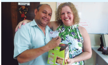
SINSERI EM AÇÃO - Em dezembro, Servidores foram ao Sindicato receber panetone e a carteirinha de sócio. Nossa iniciativa foi muito bem aceita pelos companheiros