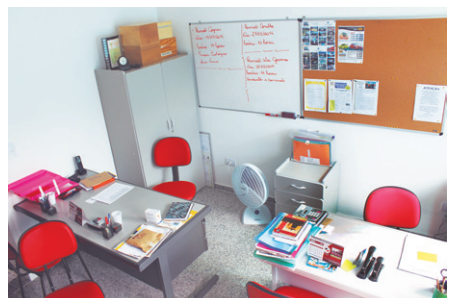
NOVO - Agora temos novo mobiliário

Materiais de escritório bem gastos, falta de ventilação e espaço pequeno são passados.